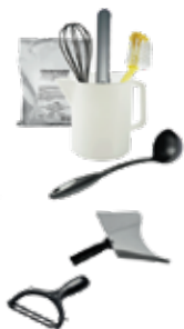
CREPERA & ACCESORIOS