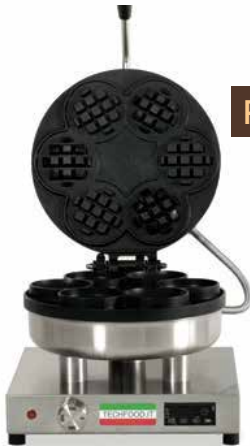
PANERA & ACCESORIOS